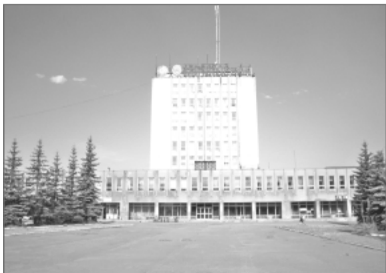
Проходная Индустриального парка «Родники». Именно с ним родниковцы во многом связывают свои надежды на успешное развитие города.

ях нужно работать. Но не все еще сказано.