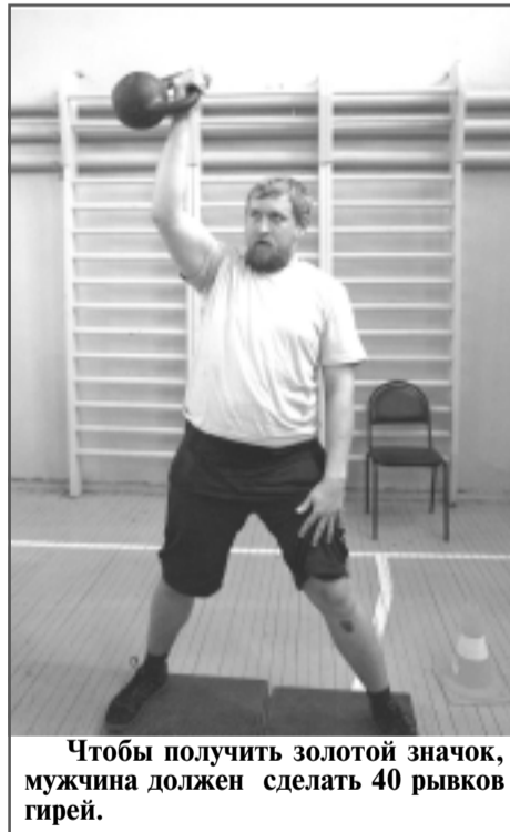
Чтобы получить золотой значок, мужчина должен сделать 40 рывков гирей.

В рамках массовой сдачи ГТО организаторы праздника - Отдел по делам