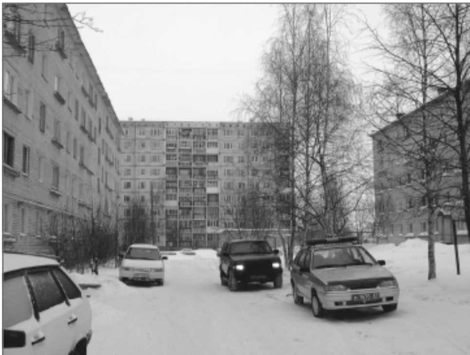
Наш город хорош в любое время года. Нам всем нужно много работать, чтобы Родники стали еще краше, еще комфортнее и удобнее для жизни. На снимке: микрорайон им. 60 летия Октября.