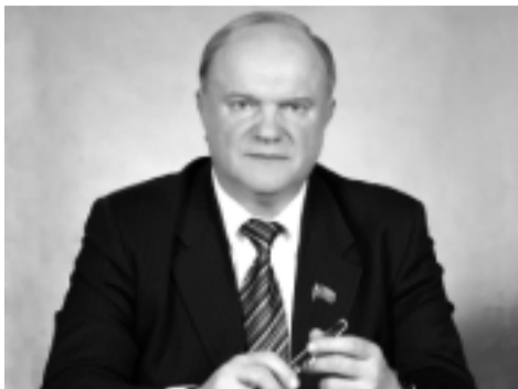
Председатель ЦК КПРФ Зюганов Г. А.

КПРФ тщательно готовится к предстоящим парламентским выборам, так как понимаем свою ответственность перед избирателями, с уважением относимся к гражданам страны, которые сегодня испытывают трудности. Выборы проходят на фоне финансово-экономического кризиса, когда в "двадцатке" ведущих стран Россия на последнем месте. В зарегистрированном партийном списке КПРФ авторитетные в стране и регионах люди, доказавшие реальным личным опытом работы в