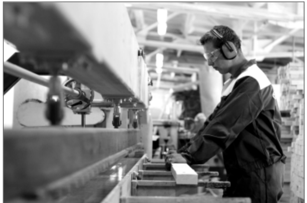
В производственном цехе ООО «АГМА»: продукция предприятия пользуется спросом далеко за пределами нашего района.

Мы - на пути новой индустриализации. Все предприятия малого бизнеса, которые планируют развивать свое произ-