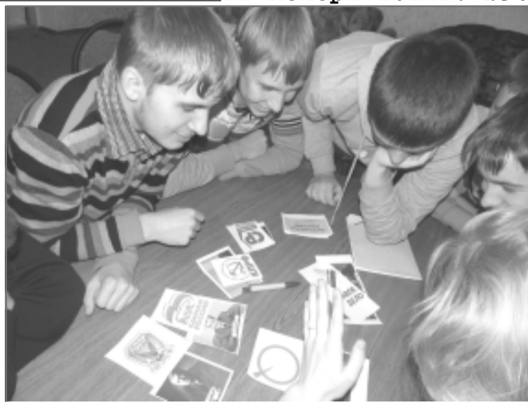
В ходе конкурса "За кого мы голосуем?" ребята вспомнили политические партии, принимающие участие в выборной кампании, их лидеров, познакомились с идеологией этих партий.