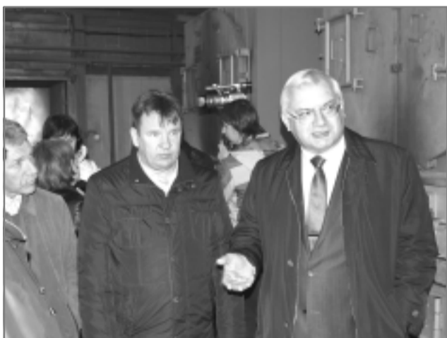
Вице-губернатор Александр Фомин и глава районной администрации Александр Пахолков оценивают реконструкцию Каминской котельной.

В среду, 8 октября, с рабочим визитом Родниковский район посетил вице-губернатор Ивановской области Александр ФОМИН