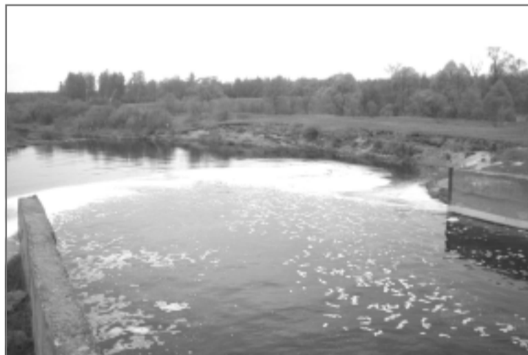
Парша в районе Шевригинской плотины. Вот бы она на всем протяжении была такой сильной и полноводной.

Беда № 2 - бобры. Раньше их не было. Запустили этих грызунов где-то в 70-е годы прошлого столетия, новоселы хорошо прижились. Одна любительница всякой живности восторженно писала, что "бобрята - веселые ребята". Раньше, когда были в моде меховые шапки,