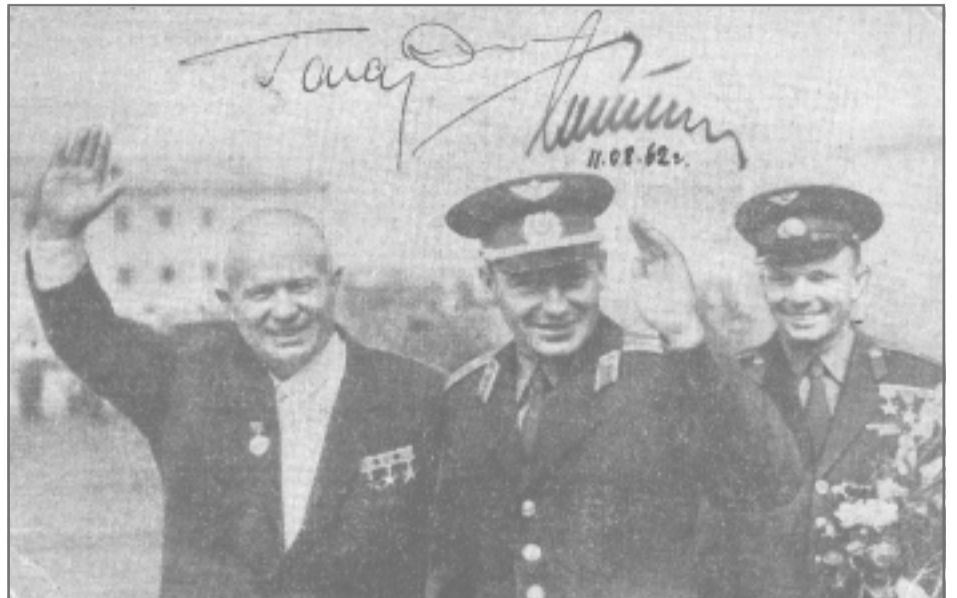
Эти автографы первых космонавтов получены на Байконуре.

бенно страшно. Космонавт-то поднимается на такую верхогуру на лифте! А нам надо не только подняться, но ещё и всё проверить, сообщая обо всём через ларинг — устройство, один конец которого крепился на шлемофоне, а другой для связи присоединялся в определенных местах к разъёмам на фермах. Потом мы спускались вниз, дожидались, когда космонавт поднимется в космический корабль, снимали технический люк и устанавливали новый — с иллюминатором, на пе-