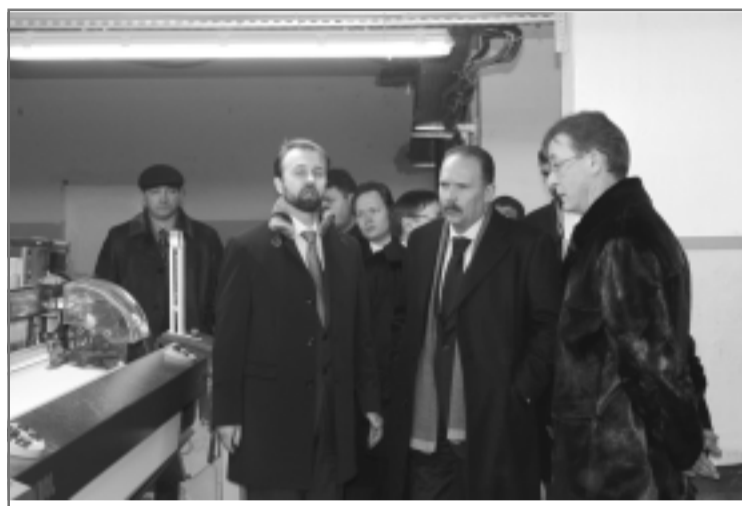
Губернатор Михаил Мень и сопровождающие его члены Правительства Ивановской области в новой ткацкой фабрике.

В рамках дальнейшего развития технопарка планируется увеличить мощность ТЭЦ до 40 МВт. Будут построены дополнительные очистные сооружения, отремонтированы тепловые сети, реконструированы существующие производственные здания, отремонтируют и дороги. Причем не только на территории технопарка, но и связывающие его