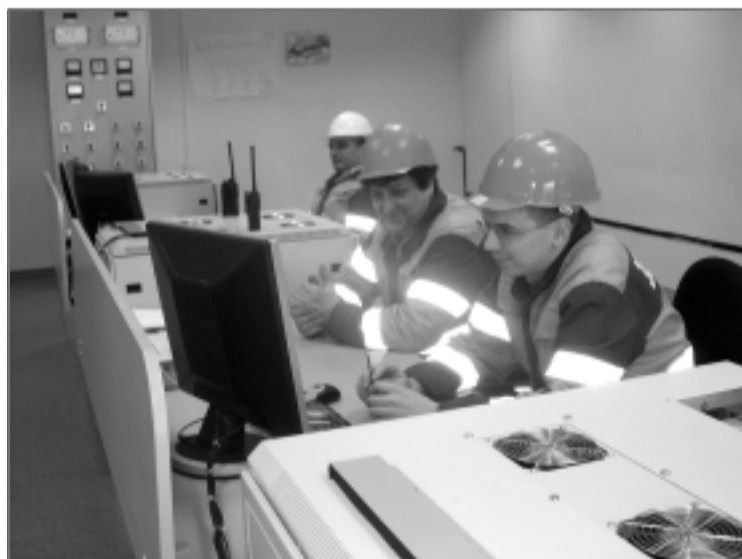
Мини-ТЭЦ: пульт управления.