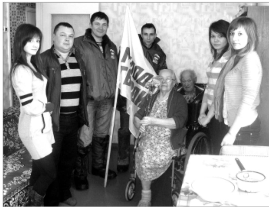
Хорошая молодежь растет у нас в Родниках. Мы с мужем — старые