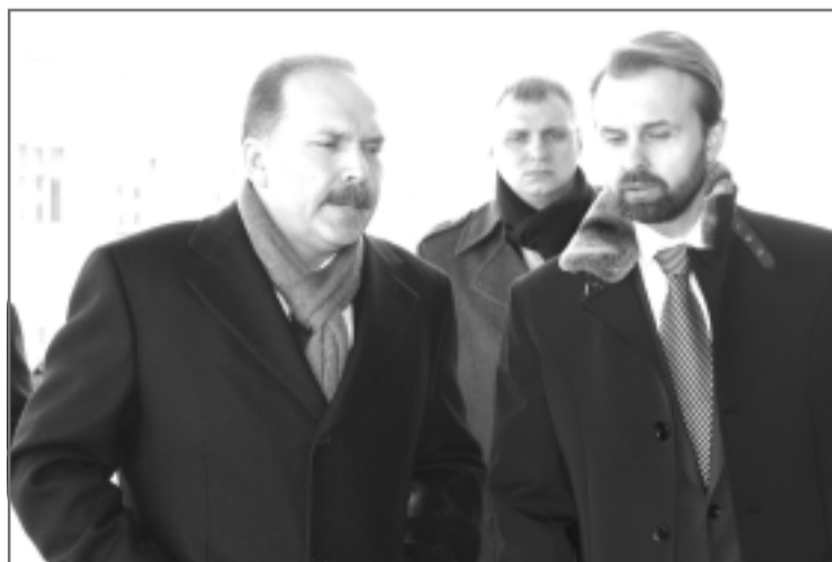
Губернатор Михаил Мень и генеральный директор ОАО корпорация «Нордтекс» Юрий Яблоков.

4 марта Губернатор Ивановской области Михаил Мень провел на Родниковском текстильном предприятии рабочее совещание по вопросу создания первого производственного технопарка на базе предприятия ЗАО ПК «Нордтекс». Прежде чем вести разговор о создании технопарка Губернатор посетил мини-ТЭЦ и новую ткацкую фабрику, оснащенную новейшим технологическим оборудованием, позволяющим выпускать качественную суровую ткань.