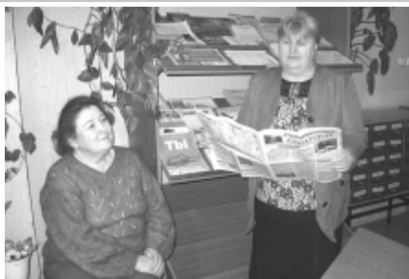
В Публичной библиотеке газета «Родниковский рабочий» занимает особое место среди разных печатных изданий. А Вы читаете нашу районную газету?