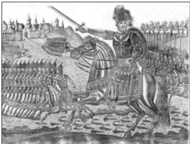
Полководец - богатырь князь Михаил Скопин-Шуйский