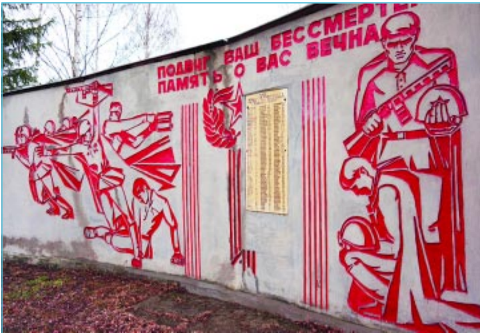
В деревне Тайманиха.