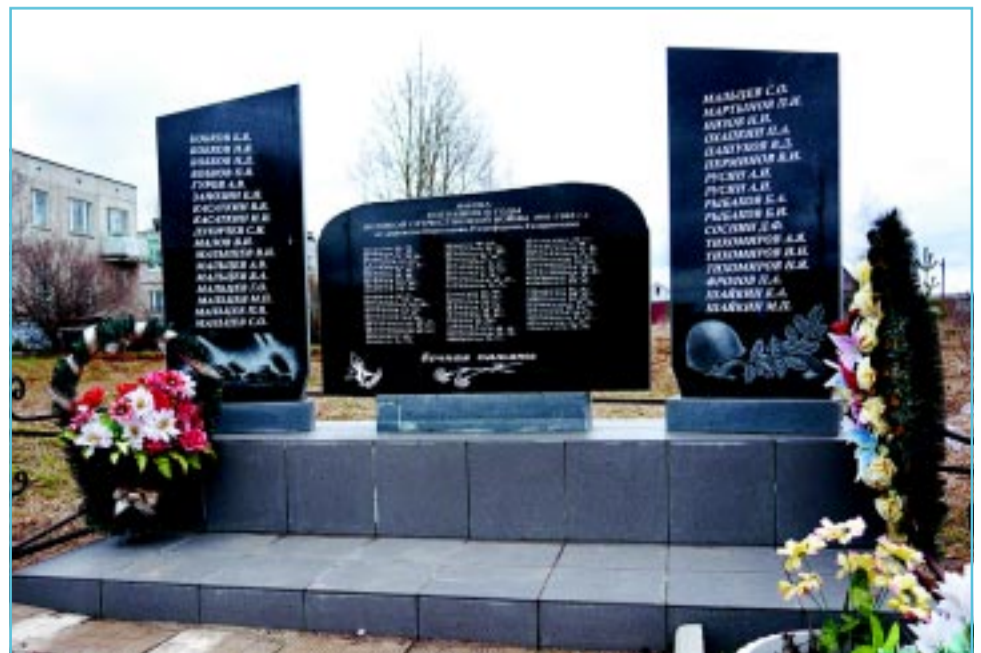
В селе Постнинский.