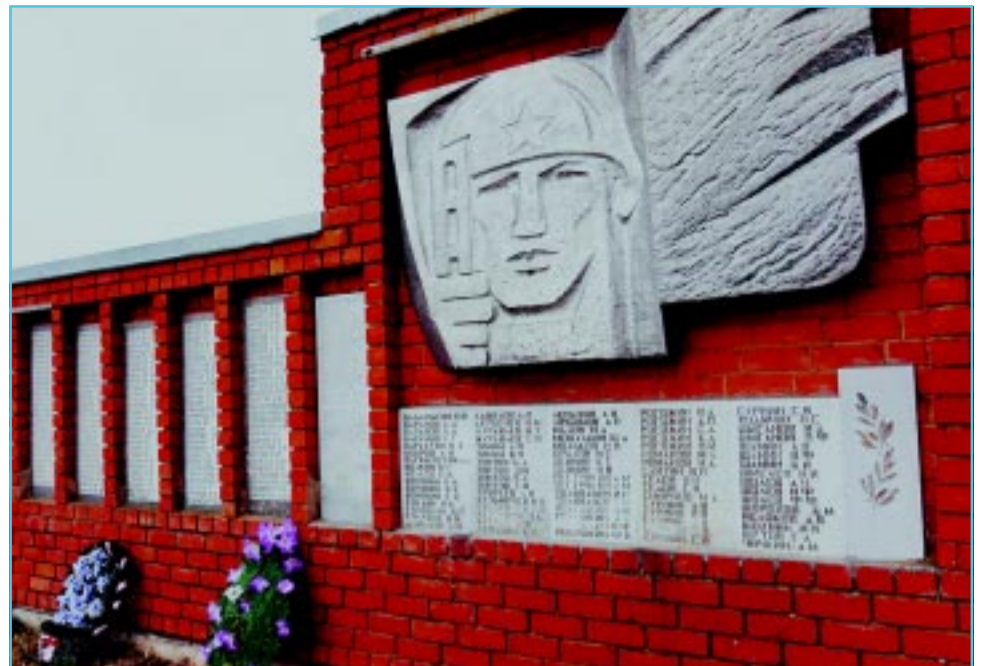
В селе Парское.