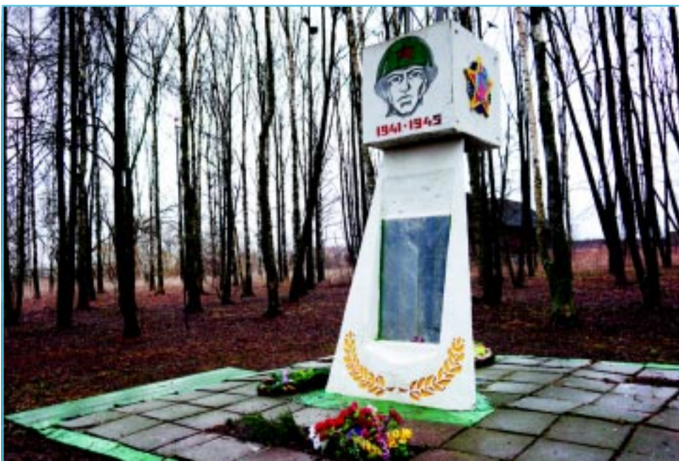
В селе Филисово.

Проходишь мимо обелиска, Замедли шаг, остановись. И голову склонивши низко, Всем победившим поклонись.