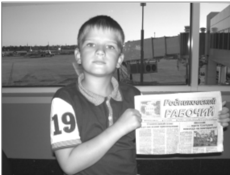
Аэропорт Анталы. Загорелый и отдохнувший, в ожидании посадки на самолет в Москву.

морском парке, где в огромных бассейнах с морской водой плавают разные экзотические рыбки. Всем посетителям дают маски с трубками и можно плавать