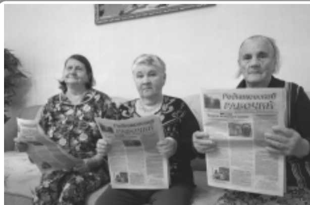
Уважаемое старшее поколение живо интересуется ситуацией в районе, читая газету «Родниковский рабочий».