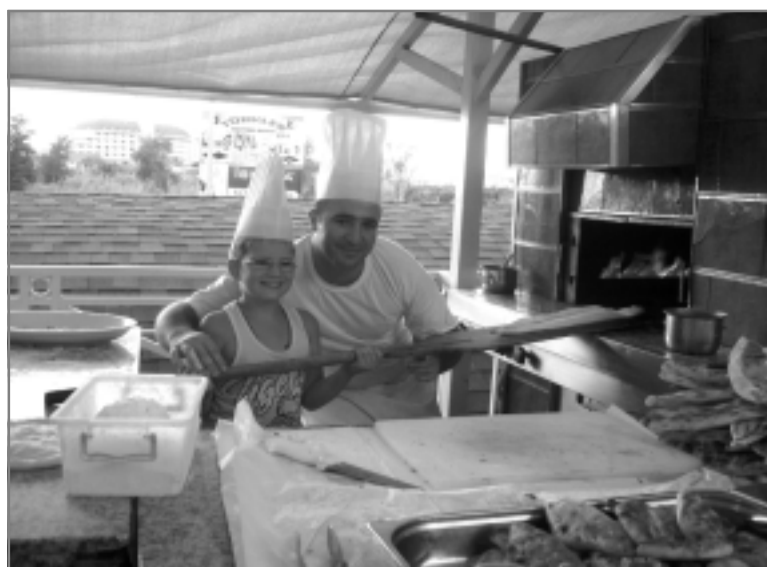
Жители Турции очень гостеприимны и радушны. Я вместе с пекарем из ресторана готовлю лодочки из теста.

с этими рыбками и любоваться видами затонувшего города. Такое место единственное в Турции.