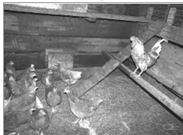
Кузьминки считаются Куриными именинами. В этот день принято угощаться блюдами с курятиной.

Но, как и многое другое во времена стародавние, даже это не особенно приятное занятие настоящим обрядовым действием сопровождалось. Старший в доме мужчина должен был сам выбрать петуха и непременно в овине отру-