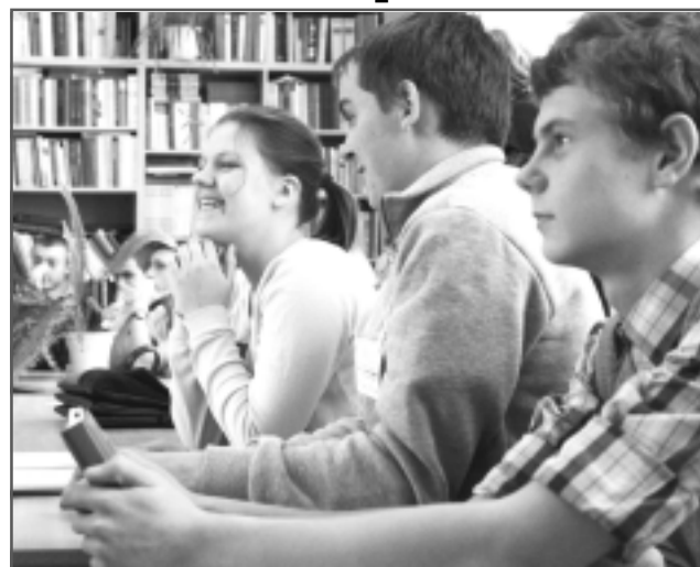
Аудитория не только слушает оппонентов, но и активно задаёт им вопросы.

"Вы молодцы, вы нашли те слова, которые нужно было сказать, - подвел ито-