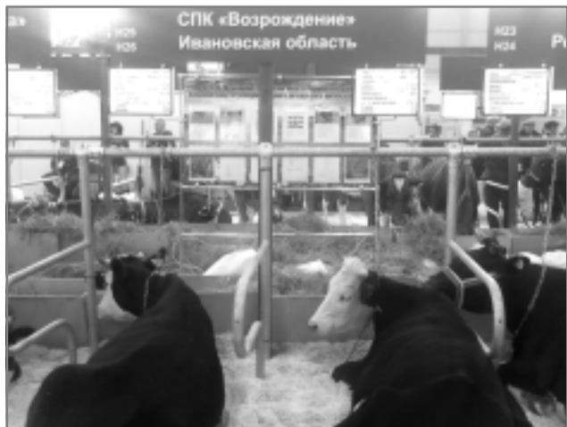
Элитные коровы ярославской породы, выращенные в СПК «Возрождение», на Всероссийской выставке «Золотая осень».

других специалистов в области разведения и содержания скота. Молодцы!