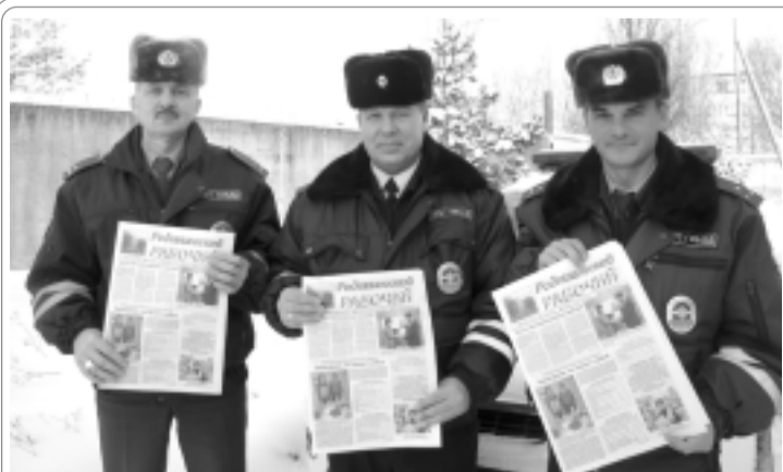
Сотрудники ГИБДД тоже читают газету «Родниковский рабочий». А Вы оформили подписку?

Прием проводится по адресу: г. Родники, ул. Техническая, д.2-а. Предварительная запись по телефону: 2-35-71.