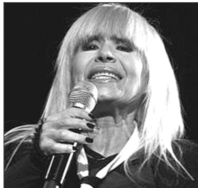
Болгарская суперзвезда Лили Иванова. Великая дива эстрады! В 73 года также любима и популярна, как и 40 лет назад. «Люблю себя больше всего на свете!», - говорит Лили. И правильно!