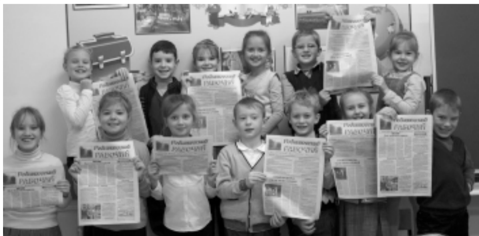
Второклашки Центральной городской школы тоже читают "Родниковский рабочий". А Вы выписали нашу газету?

Некоммерческая организация "Фонд социальных программ" 155250 Ивановская обл., г. Родники, ул. Советская, д. 8 ИНН 3721006269 КПП 372101001 Расчетный счет 40703810317000000121 Отделение №8639 Сбербанка России г. Иваново БИК 042406608 к/с 30101810000000000608 Назначение платежа - Добровольное пожертвование на строительство храма. Телефоны для справок: 8(49336)2-17-47, 89605091549.