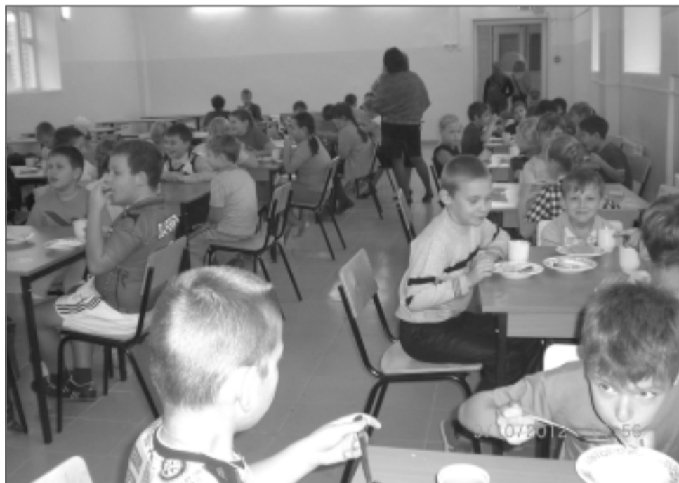
В обновлённой школьной столовой всё вкуснее! Детям здесь очень нравится!