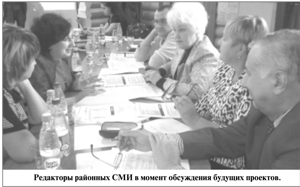
Редакторы районных СМИ в момент обсуждения будущих проектов.