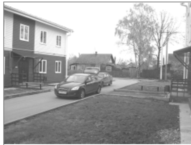
У новых домов уже появились машины. Люди обживают новое жилое пространство.