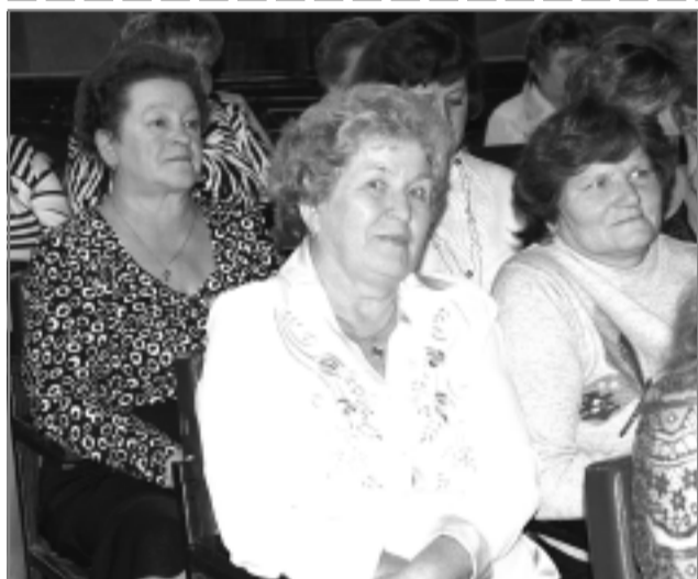
Вот они - наши дорогие сельские труженицы!