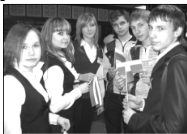
Молодые участники церемонии закрытия Года молодежи.