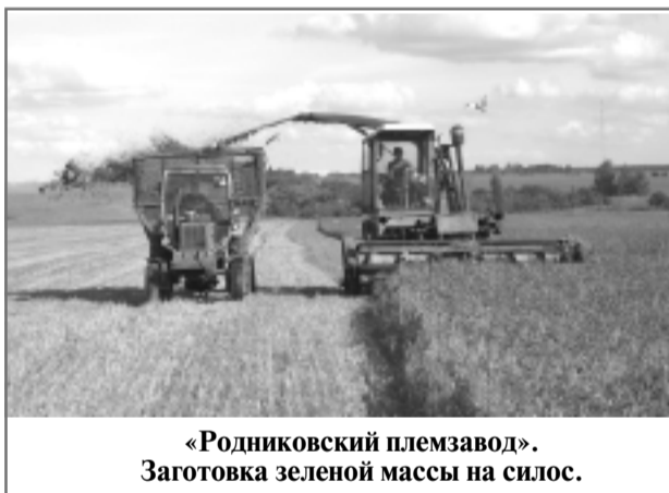
«Родниковский племзавод». Заготовка зеленой массы на силос.