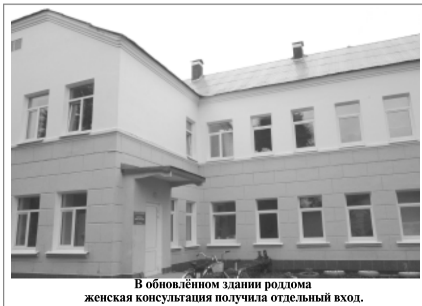
В обновлённом здании роддома женская консультация получила отдельный вход.