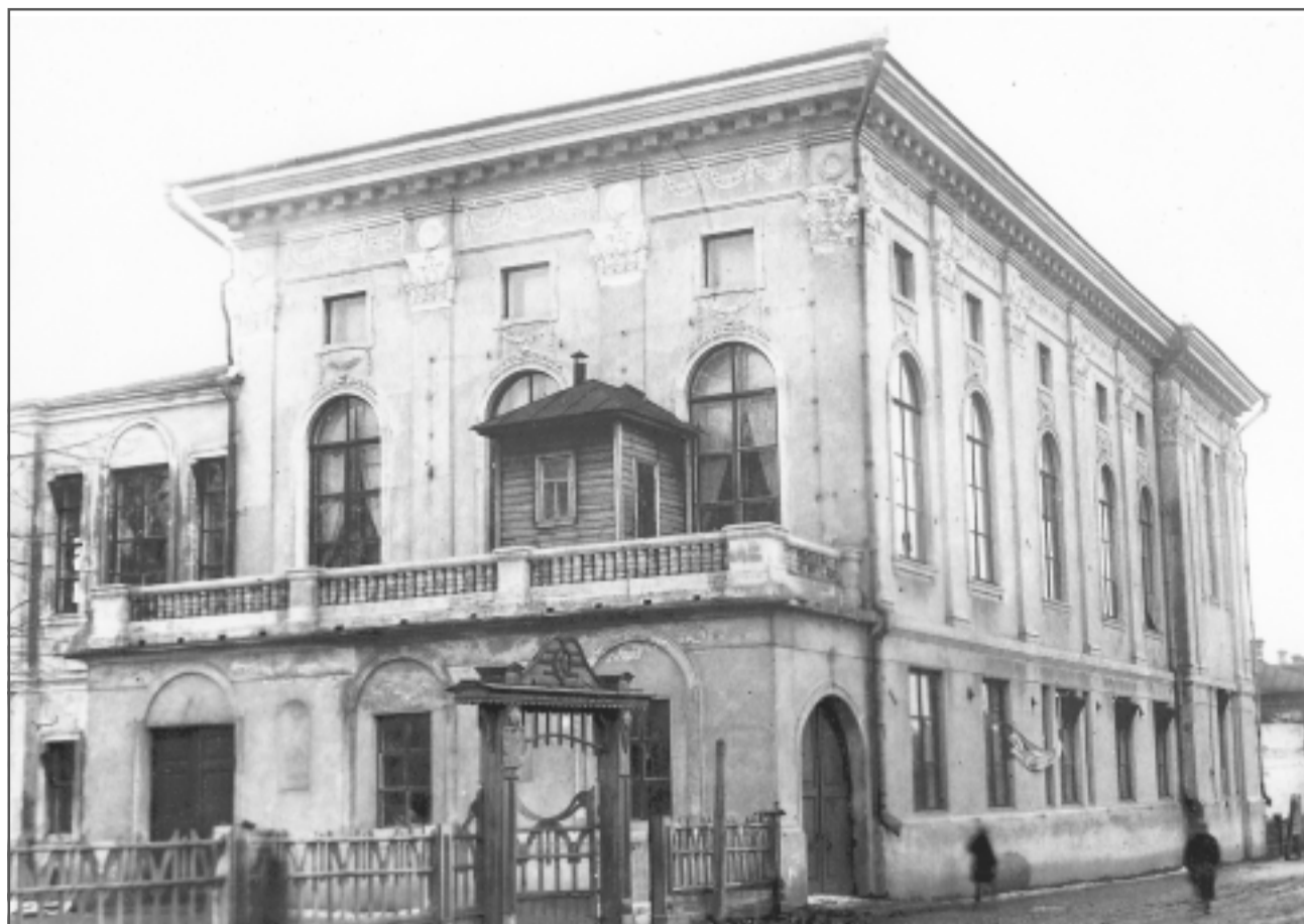
Узнали? Это самое знаменитое здание города, построенное как Дом Собраний. Но большинству родниковцев оно известно как профсоюзный клуб комбината «Большевик». Что в этом прекрасном здании теперь - знает каждый.