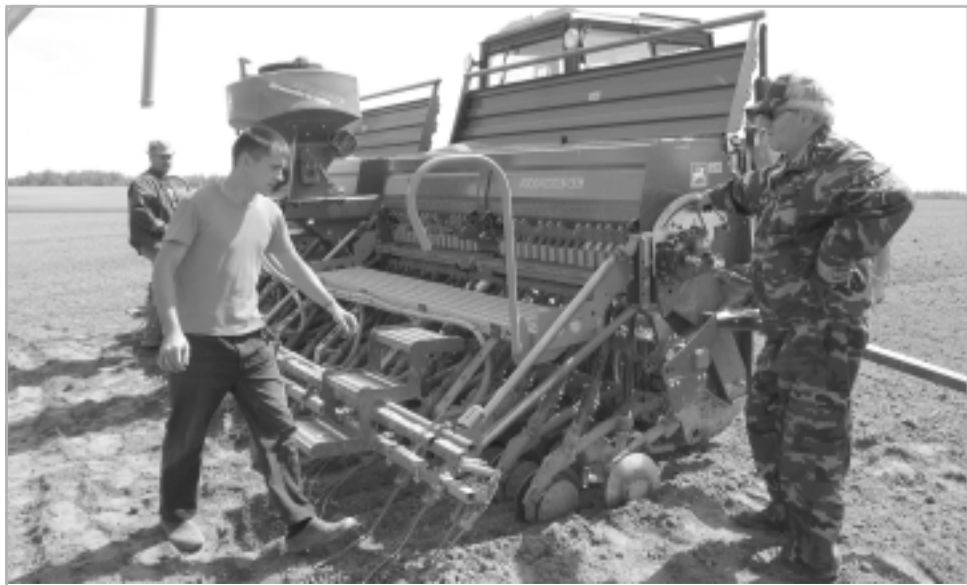
На поля района приходит новая техника. На снимке: сеялка фирмы «Амазоне» в ОАО «Заря».