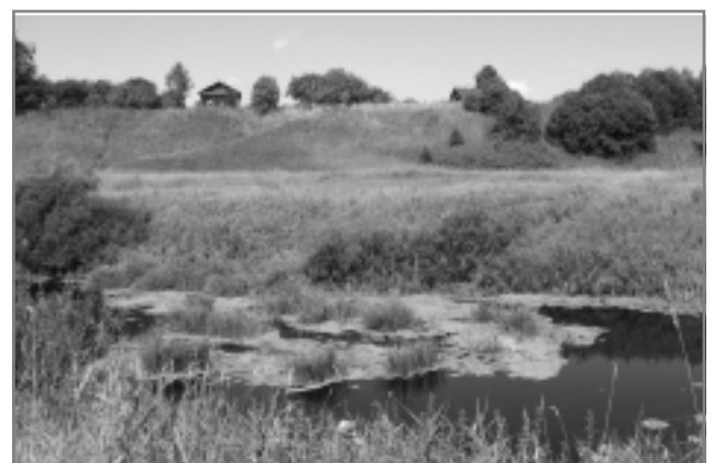
Река Теза около села Кошеева.