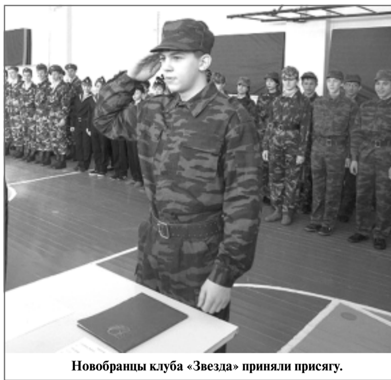
Новобранцы клуба «Звезда» приняли присягу.