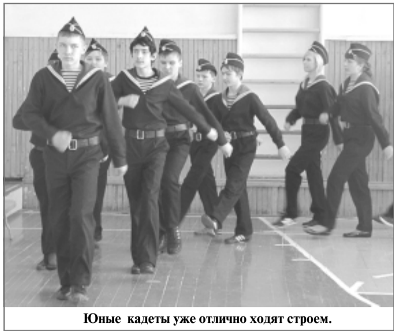
Юные кадеты уже отлично ходят строем.