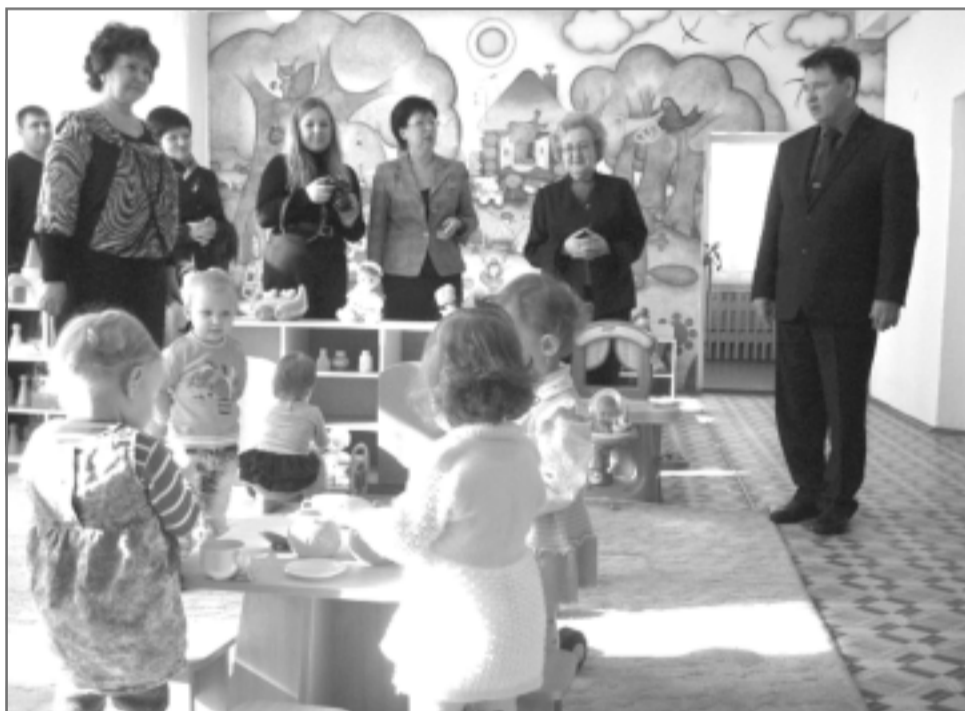
Представители власти и родители убедились, что новая светлая и уютная группа в детсаду д. Малышево пришлась городским малышам по душе.

Как сказали мне родители, они очень довольны, что их малыши, большинству из которых полтора года от роду, уже сейчас будут привыкать к коллективу, к вос-