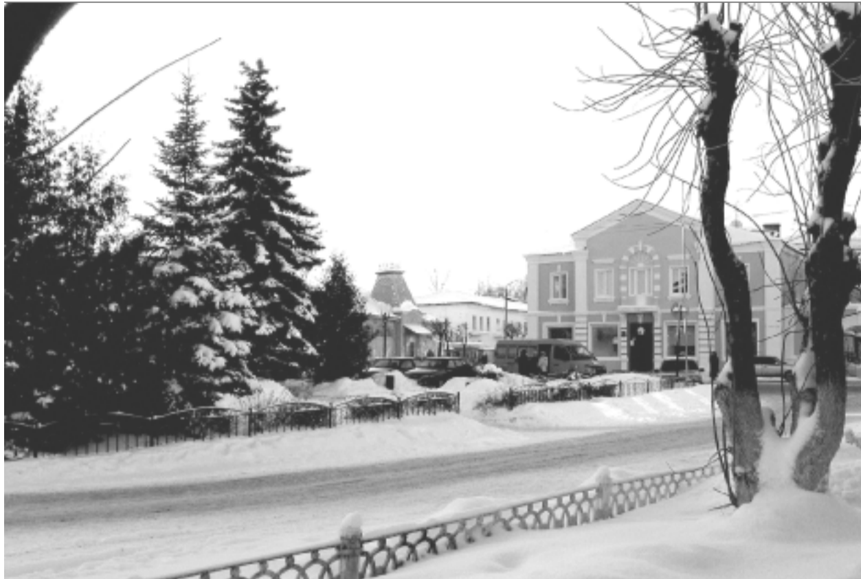
Мы любим свой город, свою страну!

традиций, идеология гордости за свою страну и желания сделать ее сильной, процветающей, всеми в мире уважаемой.