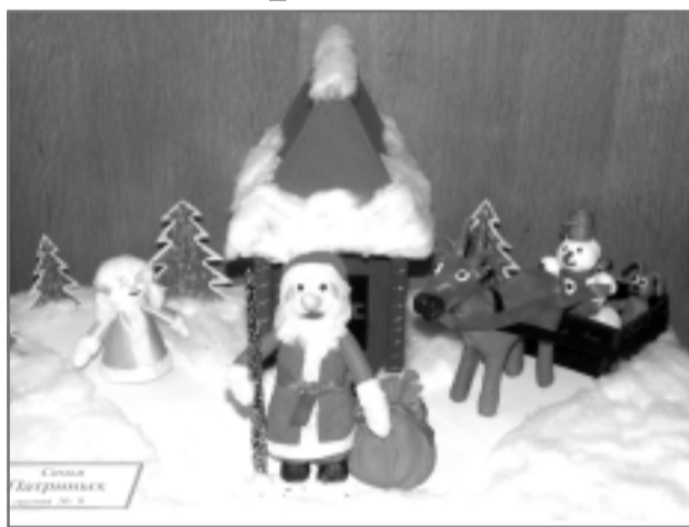
стиями, а авторы лучших работ получили Дипломы и подарки от деда Мороза и Снегурочки.

Все семьи-участницы фестиваля по его итогам награждены благодарно-