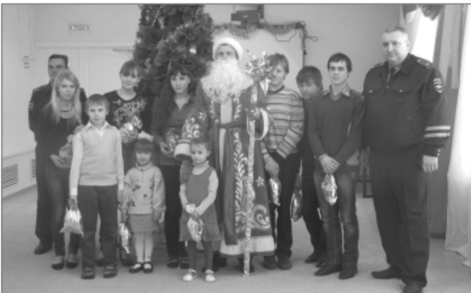
Дорогие гости из ГИБДД сделали для детей в приюте весёлый праздник.

Чтобы автомобильный замок не замерз в зимние холода, прикрепите маленький магнит к замку дверцы автомобиля на ночь и тогда замок не замерзнет.