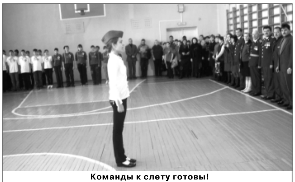
Команды к слету готовы!