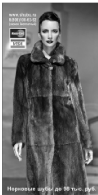
Норковые шубы до 98 тыс. руб.

Торгов. ООО "ТекстильПрофи", пл. ЦДРП №1782 от 15.02.2008