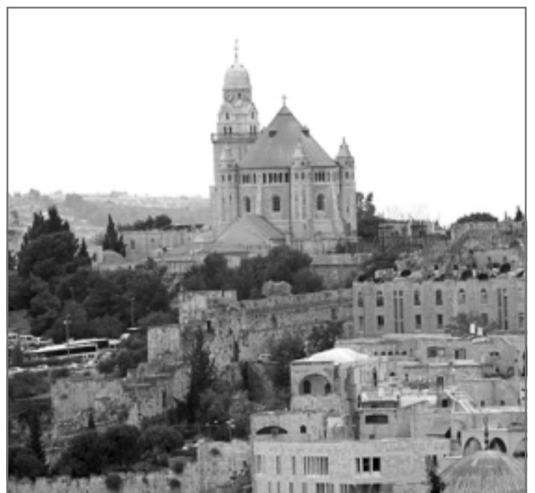
Древний Иерусалим сегодня.

В Вифлееме Храм Рождества построен в 4 веке императором Константином над пещерой, где родился Спаситель. Он единственный на Святой Земле, сохранившийся с тех времён. Место рождения Богомладенца обозначено там 14-конечной звездой - символом 14 родов предков Спасителя по плоти (их перечисляет евангелист Матфей). Интересен вход в Храм - низкая дверь, куда