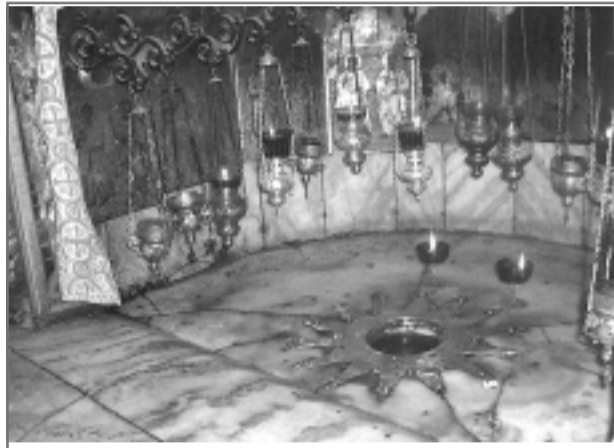
В Храме Рождества в Вифлееме.

Святому Семейству - старцу Иосифу и Деве Марии, прибывшим в Вифлеем, город царя Давида, для прохождения переписи не нашлось места в самом городе - все гостиницы и дома были заняты. Им пришлось остановиться в холодной пещере - укрытии для скота. Марии пришлось родить. Она родила Сына и, спеленав, положила его в ясли - кормушку для скота. Господь, Царь Мира, пришёл на зем-