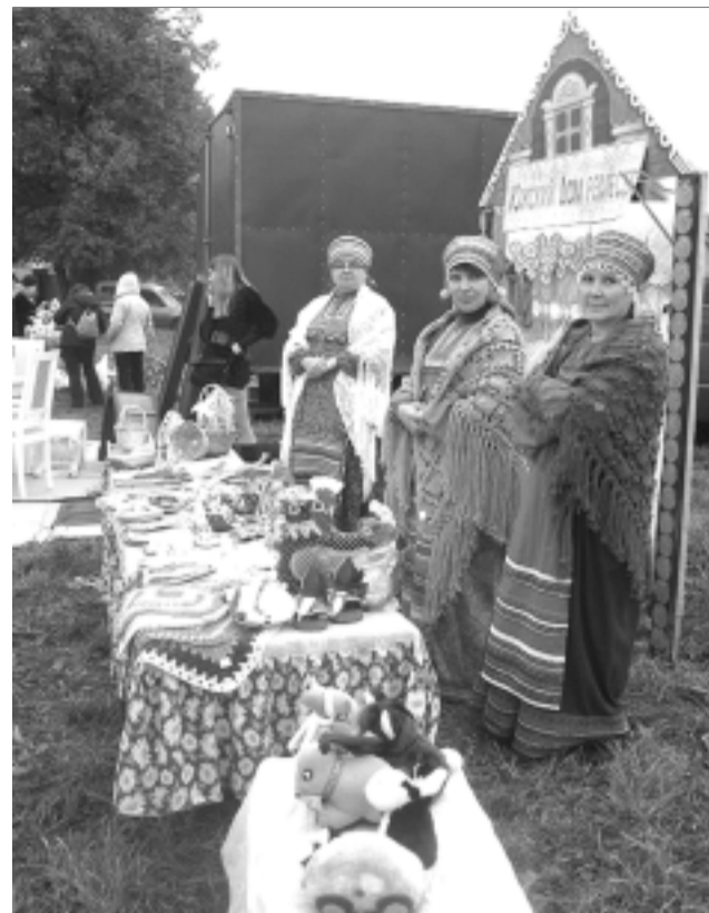
Со всей области съехались в Парское торговцы и мастера. На снимке: прилавок Южского Дома ремёсел.