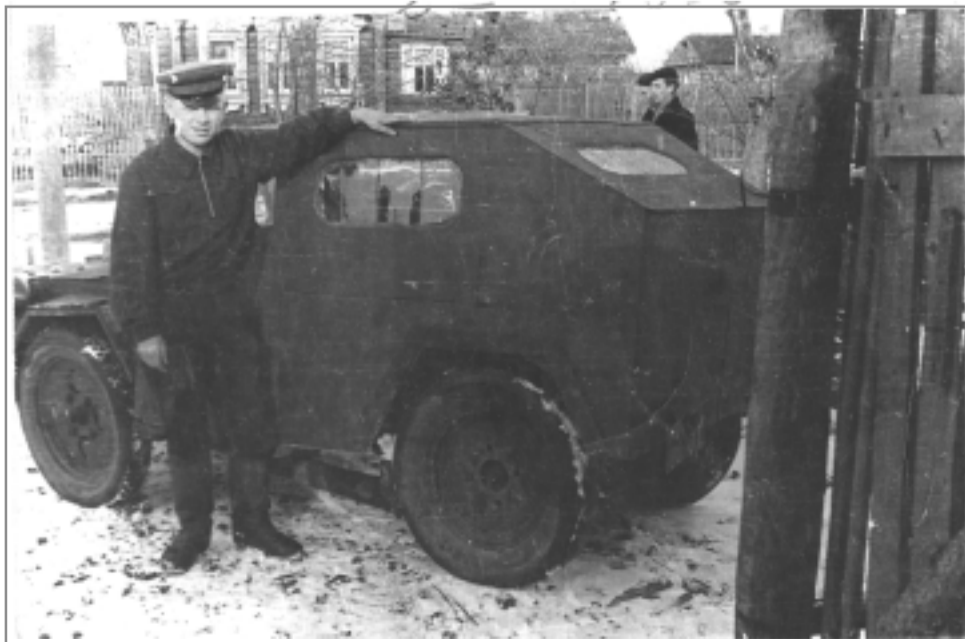
«Ласточка» № 2 конструкции Михаила Грошева. 1956 год.