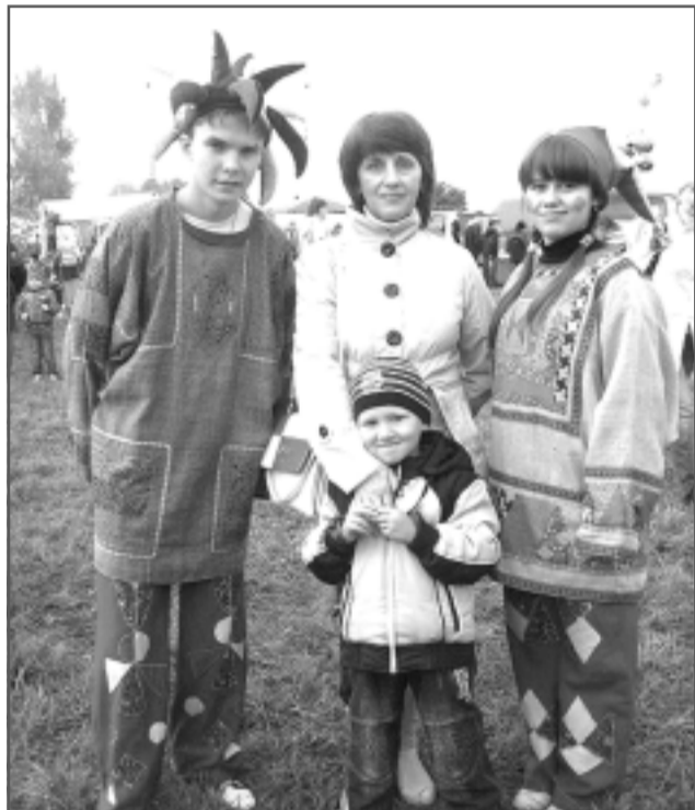
Гостей Парской ярмарки развлекали весёлые скорморохи, с которыми можно было сфотографироваться.